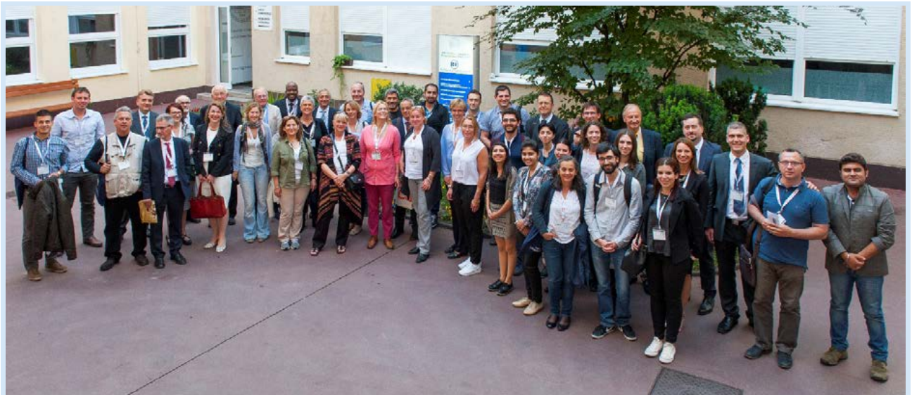
Slika 1. Zajednička fotografija sudionika simpozija Figure 1 All together photo of the symposium participants